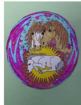
Groetjes van Isa (groep 6B)

Laatst toen ik overbleef zag ik een super leuke kleurplaat. Ik ging hem meteen inkleuren. Na een paar dagen had ik een heel mooi resultaat. En dat kwam door alle mooie pennen en stiften die de overblijf had!